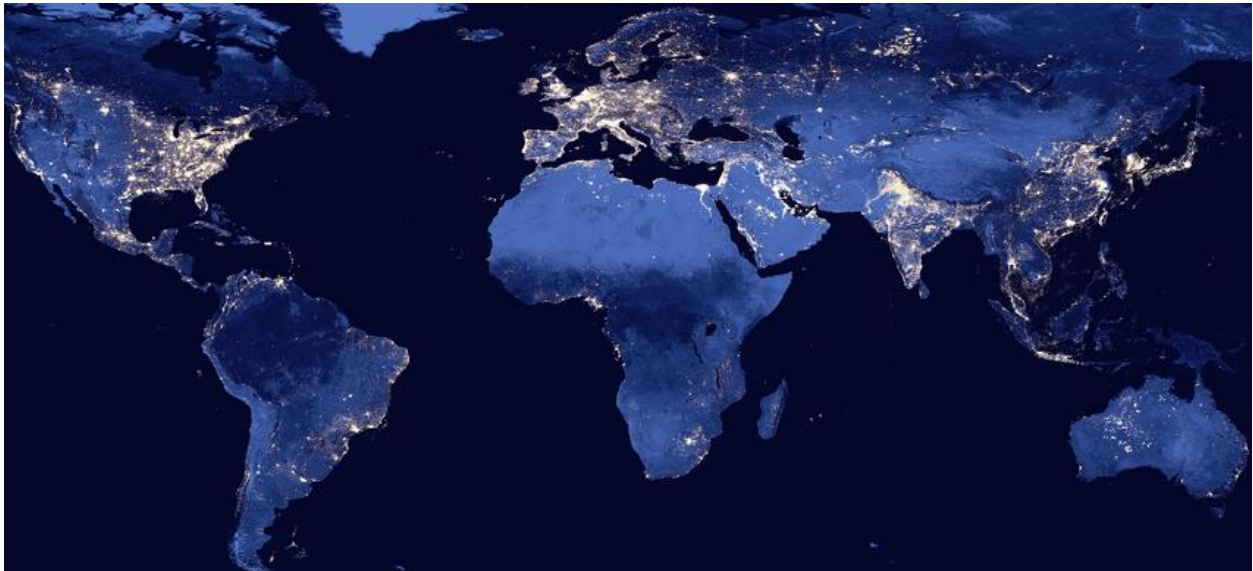
Le monde nocturne vu depuis l'espace

Qu'est-ce la pollution lumineuse? Le public est si peu informé que cette question est très pertinente. Concrètement, ce terme indique le débordement de lumière provenant de l'activité humaine perturbant l'écosystème naturel. Il est facile de la visualiser car on y est constamment exposés. Par exemple, dans les photos nocturnes, on distingue souvent un trait caractéristique de lumière envahissant le ciel, le "skyglow". On peut comprendre la vraie magnitude de cette pollution à l'échelle globale grâce à des photographies de satellites: