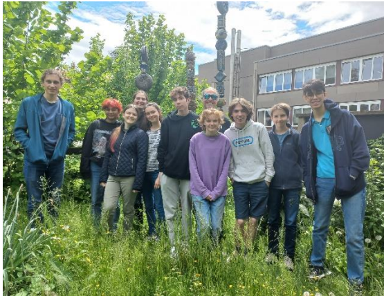
"L'Éco-Crew" à l'Ecole Internationale de Genève organise des actions écologiques