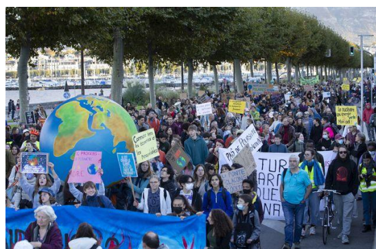
Le climat, une problématique centrale pour les jeunes et les adultes à Genève (RTS, 2021)

exactement cela que font les organisations pour les jeunes.