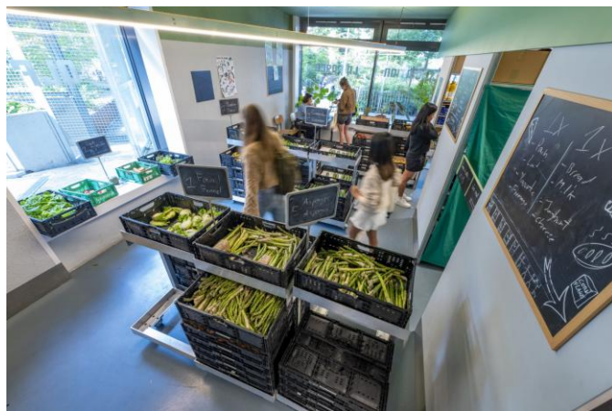
L'épicerie La Farce, un espace de distribution alimentaire gratuite pour les étudiants.

La Farce aide tous les étudiants de niveau tertiaire (Université, HES, etc.) et contribue grandement à la lutte contre la précarité et le gaspillage, en récupérant des produits encore consommables auprès d'épiceries, de boulangeries ou de marchés, afin de les redistribuer ensuite.