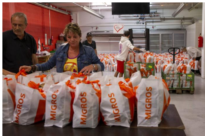
Produits récupérés et redistribués par l'association La Farce.