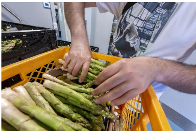
Bénévoles de La Farce lors d'une distribution.